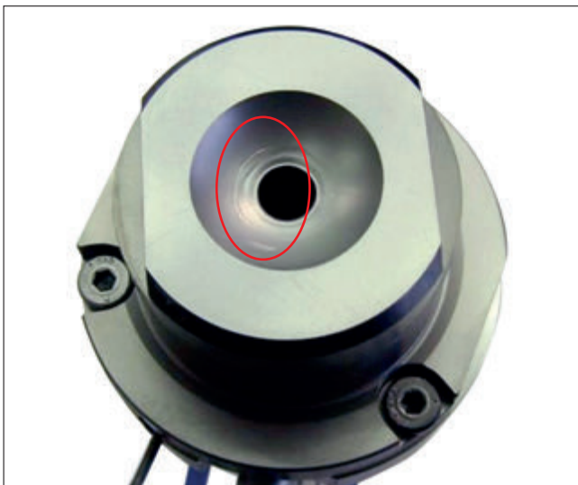
Abb. 2: Beschädigte Heißkanaldüse aufgrund einseitiger Anlage der Maschinendüse auf einem schmalen Ring. Die geringe Kontaktfläche erlaubt nur eine eingeschränkte Wärmeübertragung. Fig. 2: Hot-runner nozzle damage due to one-sided contact of the machine nozzle on a narrow ring. The insufficient contact area allows only a restricted transmission of heat.

However, it must be taken into consideration that this variant requires two control zones and necessitates a higher mould construction. As a rule, the price of the hot-runner nozzle with a heated adapter is higher than that of a comparable single nozzle.